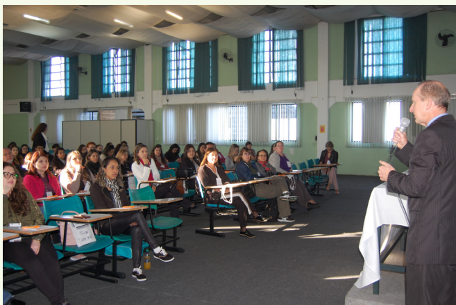
O encontro reuniu mais de 100 pessoas