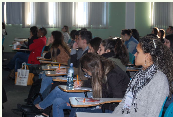
Entre os participantes, alunos e profissionais do Paraná, Santa Catarina e São Paulo